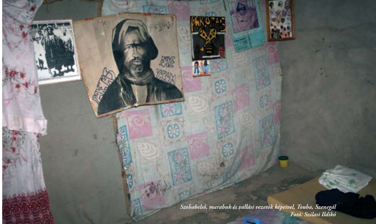
Szobabelső, marabuk és vallási vezetők képeivel, Toubá, Szenegál